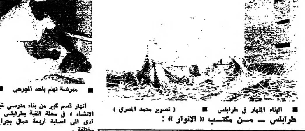
البناء المنهار في طرابلس

مصادرة كمية من الدخان المهرب وإحراقها على دفعات طرابلس - من مكتب «الانوار» فقدت عناصر من الكفاح الفلسطيني المسلح، بحملة اصمارة الدخان المهرب في مخيم نهر البارد، وضجت حوالي ستة آلاف علبة دخان، واهرقها على دفعات. وقال مسؤول في الكفاح المسلح، ان هدف العملية، المحافظة على سمعة المخيم، بعد ان كثر باعة الدخان المهرب على طول الطريق. وكان قد عقد اجتماع في مكتب امير فصيلة درك عسكر الامم اول غسان حمصي، حضره مسؤول من الكفاح المسلح وبعض ضباط الجبرك، ووضعت خطة للتنسيق بين هؤلاء المسؤولين بغية مكافحة بيع الدخان الاجنبي المهرب، مع رفع التوصية الى المسؤولين في الرجي، وبضرورة تسهيل اعطاء رخص بيع دخان الادارة في المخيم.